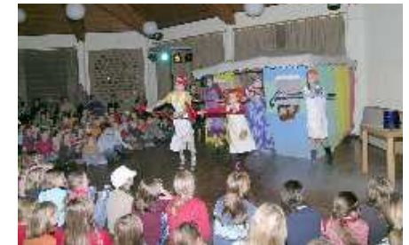
Musical „Pippi Langstrumpf“

Am 19.11.05 war ein großes Jubiläumsfest zu 30 Jahre Bezirksstelle für Kinder- und Jugendarbeit. Rund 200 Kinder und 80 Erwachsene erlebten einen bunten Vormittag mit dem Musical „Pippi Langstrumpf“, mit Mitmachliedern, einem Märchenerzähler und einem Kinderkonzert von den Ten Sing Kids. Dann gab es für alle kostenfrei frische Waffeln und Getränke. Mit vielen bunten Luftballons zogen die Kinder mit ihren Betreuerinnen und Betreuern fröhlich ihre Straße.