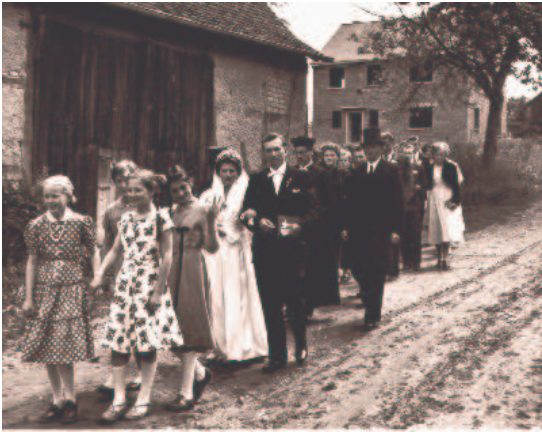
Hochzeit Juni 1956 mit Pfarrhausneubau im Bildhintergrund

Beim letzten Seniorenadventsnachmittag wurden auf der Leinwand Bilder von früher gezeigt. Einige Seniorinnen und Senioren waren darauf als junge Mädels und Buben zu sehen.