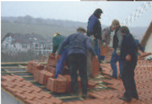
links: Dachdecken beim ersten Schneefall. - Das Ziel ist erreicht: Die Pfarrhausgarage hat vor dem Winter „ein Dach überm Kopf“.

Ein ganz herzlicher Dank gilt allen Helferinnen und Helfern, die mit zum Teil hoher Stundenzahl immer wieder geholfen haben, dass der Bau so weit gekommen ist! ■