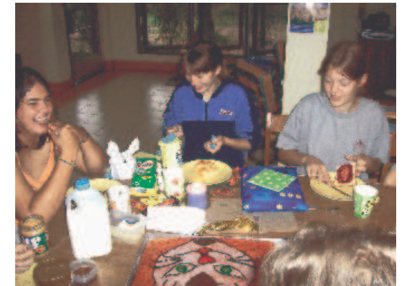
Abendessen im Internat

Wir hatten einen Laternenumzug an der deutschen Schule mit großem Buffet und selbst gebastelten Laternen. Der deutsche Adventsgottesdienst mit Punsch und Plätzchen fand bei kühlen 30 Grad statt.