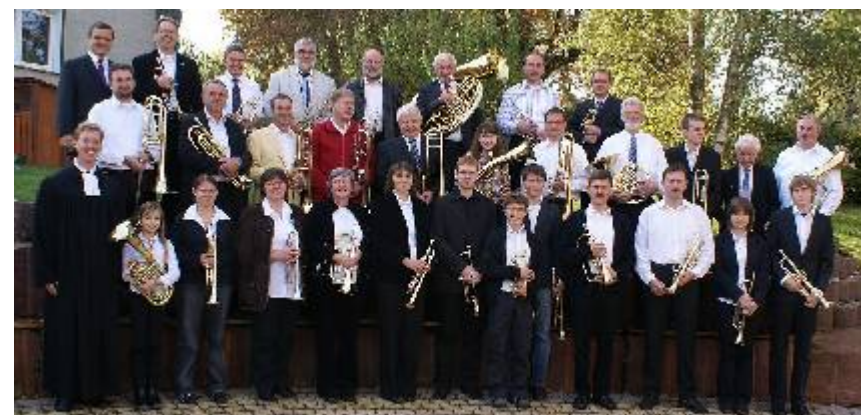
Wenkheimer Posaunenchor mit Unterstützung aus dem Kirchenbezirk

Mit dem Schlusslied „Herr, bleib bei mir“ und dem Segen endete der Festakt in der Kirche. Es schloss sich ein gemütliches Beisammensein im Gemeindehaus neben der Kirche an. Dort war auch eine kleine Ausstellung aufgebaut, die Bilder aus älteren und jüngeren Zeiten über die Arbeit des Posaunenchores zeigte.