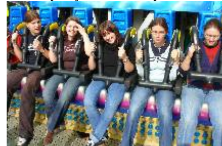
Nicht nur geistlich, auch im „Free-fall-Tower“ wollen sie „nach oben“

Natürlich gab es auch ein gutes geistliches Programm. In gemeinsamer Stiller Zeit am Morgen, in Andacht, Bibelarbeit und dem abschließenden Brunchgottesdienst ging es um die Bergpredigt. „Hammerhart, was Jesus da sagt!“ - Da geht es ganz zentral um die Frage, was Jesus von uns will.