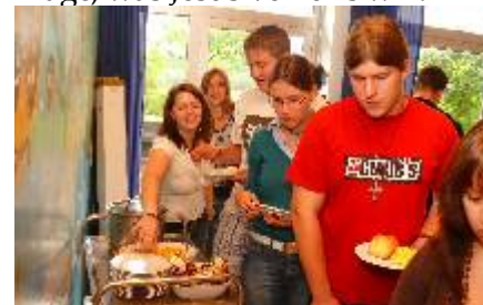
Leckeres Essen (auch) beim Brunch

Natürlich gab es auch ein gutes geistliches Programm. In gemeinsamer Stiller Zeit am Morgen, in Andacht, Bibelarbeit und dem abschließenden Brunchgottesdienst ging es um die Bergpredigt. „Hammerhart, was Jesus da sagt!“ - Da geht es ganz zentral um die Frage, was Jesus von uns will.