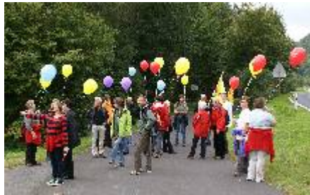
Luftballons als sichtbares Zeichen

Im Sommer hatten fünf kirchliche Mitarbeiter aus Ghana den Kirchenbezirk Wertheim besucht. Auch in unserer Gemeinde war die Gruppe mehrmals zu Gast. Zwei von ihnen hatten sogar 10 Tage in unserer Gemeinde gewohnt.