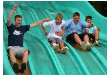
Rutschparty im Freizeitpark

Rund 100 Leute aus verschiedenen Gemeinden nutzten die Möglichkeit, ihre Solidarität mit Ghana zu zeigen. Für die Teilnehmer gab es die Möglichkeit selbst eine Spende zu geben oder sich für gelaufene Kilometer sponsoren zu lassen. Der Rotary-Club gab als Zugabe je 10 € pro Teilnehmer, so dass eine stattliche Summe für Straßenkinder in Accra, der Hauptstadt von Ghana, zusammen kam. Klaus Reinhart ■