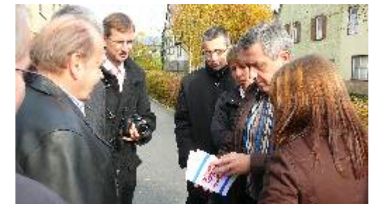
Israel-Thementag - geführter Spaziergang ↖