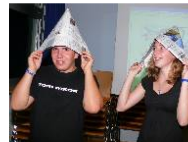
↗ „Weltreiseabend“ Jugendfreizeit