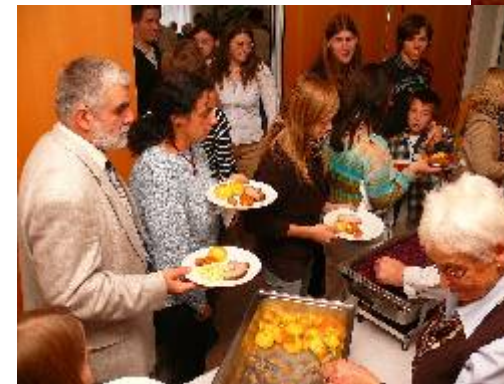
↓ Essen beim Posaunenchorjubiläum.