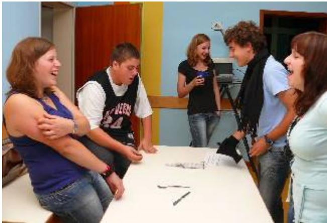
Action beim Spiel- und Spaß-Abend

Das war nun Jugendfreizeit Nummer 3 in Folge. Und dieses Mal gab es in Markt Bibart so viel „Freizeit“ wie bei keiner der beiden zuvor. Und das gilt sowohl vom zeitlichen Umfang, wie auch inhaltlich: Die bisherigen Freizeiten waren nur freitags bis sonntags. Dieses Mal haben wir bereits einen Tag früher, nämlich am Donnerstag, den 4. September 2008 begonnen. Bei der ersten Freizeit im Jahr 2006 (Klotzenhof) stand inhaltlich die Standortbestimmung der Jugendarbeit im Vordergrund. 2007 (Markt Bibart) haben wir dann unter dem Motto „Entdecke was in dir steckt“ an dem