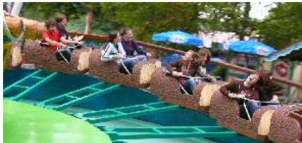
Fahrtwind in Geiselwind

Freitags waren wir einen ganzen Tag im Freizeitpark Geiselwind. Der Eintrittspreis hierfür war im günstigen Freizeitpreis von 60 Euro bereits enthalten. In kleinen Gruppen wurde der Park erkundet und die Fahrgeschäfte genutzt bis es einem schlecht wird ... Das machte super viel Spaß. - Spielerisch war am Donnerstagabend und Samstagnachmittag einiges geboten.