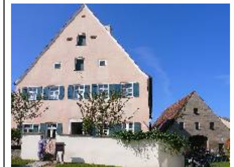
Freizeit in Fiegenstall 2009 ■

Auch nächstes Jahr wird das wieder so sein. Merkt euch den Termin gleich vor: Vom 10. - 13. September 2009 gibt es wieder eine Jugendfreizeit mit viel Freizeitwert und geistlichem Tiefgang. Diesmal fahren wir in die Nähe von Brombachsee und Altmühltal, nämlich nach „Fiegenstall“ (ja, tatsächlich ohne „L“ an zweiter Stelle) bei Pleinfeld. Wenn du Teenager, Jugendlicher oder junger Erwachsener bist, dann komm doch mit! Es wird bestimmt „echt cool“.